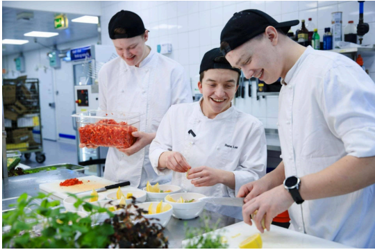
Kokkelærlinger på kjøkkenet i Rena leir.