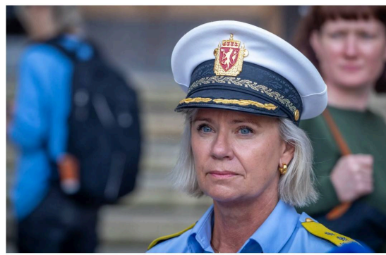
Politimester Ida Melbo Øystese i Oslo politidistrikt. Skjermdump, politimester i Oslo politidistrikt Ida Melbo Øystese.