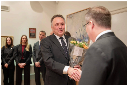
Nøkkeloverrekkelse da Tore O. Sandvik overtok som ny forsvarsminister etter Bjørn Arild Gram.

konferansen på Akershus festning. Foto: Torbjørn Kjosvold / Forsvaret.