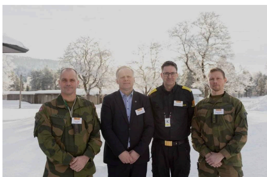
Representanter fra Heimevernet, politiet, Statsforvalteren og private bedrifter samlet for kursing i beredskap.