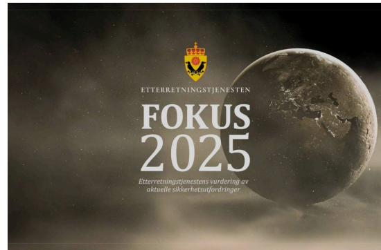
Etterretningstjenestens trusselrapport for 2025.