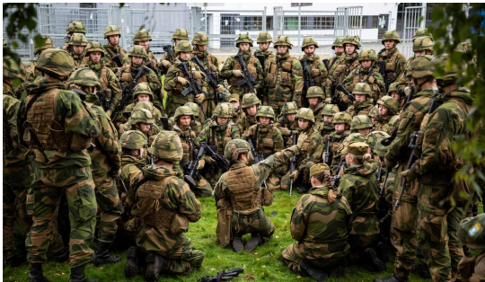
CUF-leksjon (care under fire), rekruttskole 2407.