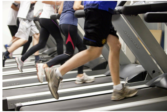
Løpetest under sesjon

Cyberangrepene vi observerer i dag blir ikke bare flere, men de blir også mer avanserte. Fremfor å angripe en enkelt virksomhet eller ett enkelt mål, retter trusselaktørene i økende grad sine operasjoner mot leverandører og leverandørkjeder.