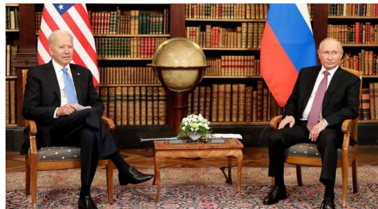
Ved å oppfatte fienden og oss selv, vil det ikke bli noen uforutsett risk i noen slag. Sun Tzu - Krigskunsten

Ved å oppfatte fienden og oss selv, vil det ikke bli en uforutsett risk i noen slag. Sun Tzu - Krigskunsten Illustrasjon: Stratagem