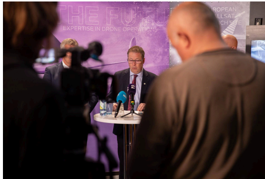
Forsvarsminister Bjørn Arild Gram holder pressekonferanse ved Andøya Space i 2023