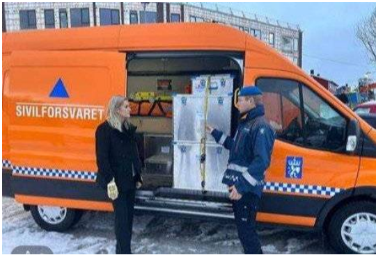
Justis- og beredskapsminister Emilie Enger Mehl besøkte Troms sivilforsvarsdistrikt 2023.