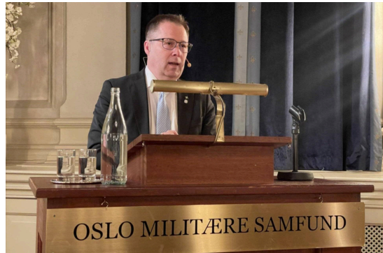
Forsvarsminister Bjørn Arild Gram i OMS februar 2024.