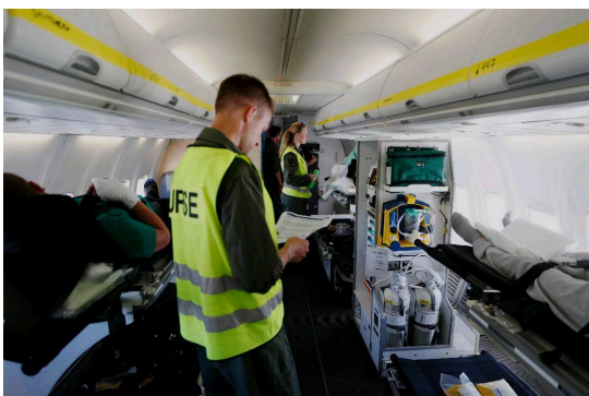
Hver uke fylles vanlige SAS-passasjerfly med hardt skadde ukrainere som skal flys til europeiske sykehus for behandling, foto, Foto: Forsvaret.