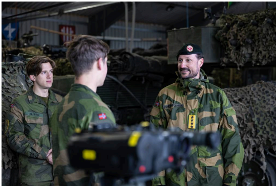
HKKH Kronprins Haakon på besøk hos den norske EFP15-styrken i Litauen