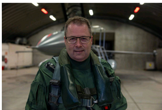
Forsvarsminister Bjørn Arild Gram