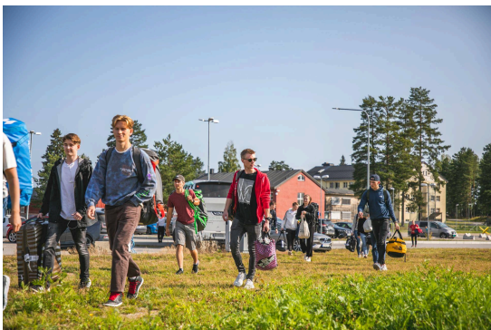
Nye soldater har innrykk på Sessvollmoen ifm gjennomføring av førstegangstjenesten i Hæren / foto: Frederik Ringnes / Forsvaret.