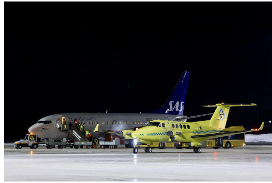
Forsvarets luftevakueringsgruppe ankommer Gardermoen med pasienter og pårørende fra Ukraina / foto: Frederik Ringnes / Forsvaret.