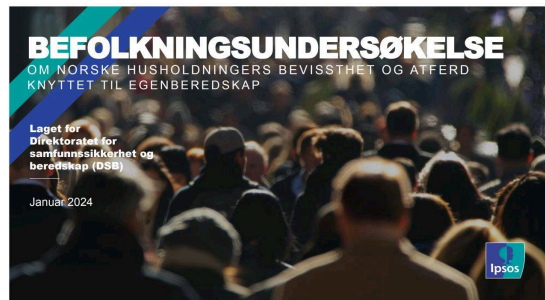
Befolkningsundersøkelse om egenberedskap / DSB.