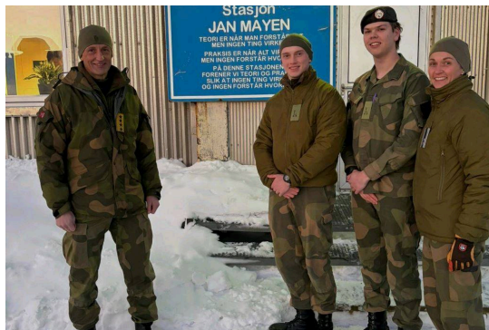
Cyberforsvarslærlinger og forsvarssjef på Jan Mayen