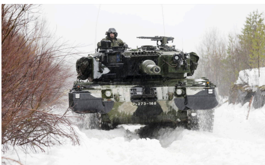
Leopard stridsvogn fra den finske hæren under vinterøvelsen CR 2022

Fylkeskontakt Wenche Meinich-Bache NTF Rogaland