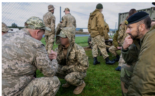
Operativ resilienstrening (ORT) / foto: Forsvaret.