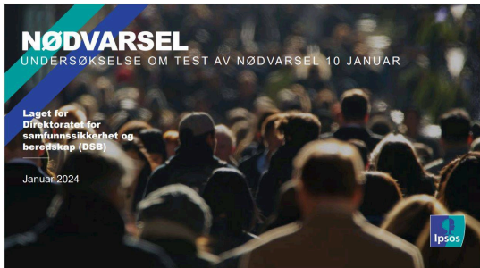
Undersøkelse om test av nødvarsel 2024 / DSB.